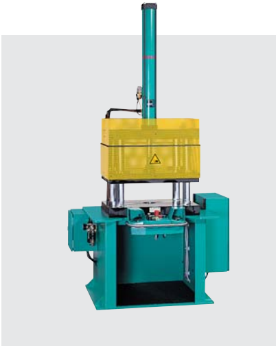
Bild zeigt: Steif ausgelegte 4-Säulen-Pressen. Flexibel auch in Sondergrößen lieferbar.